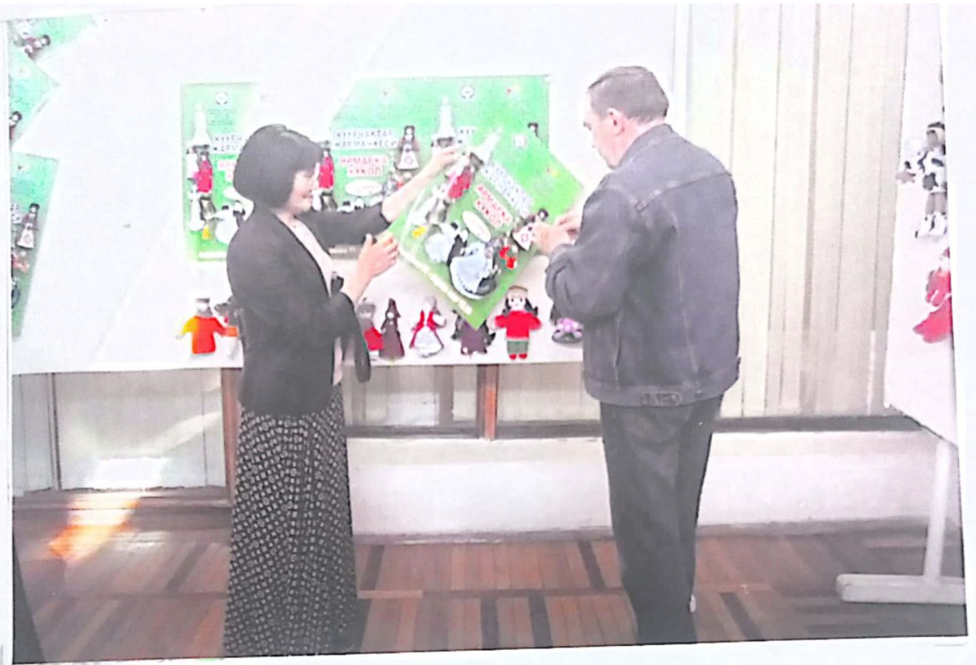
Т. Айтиев атындагы сурат музейинде